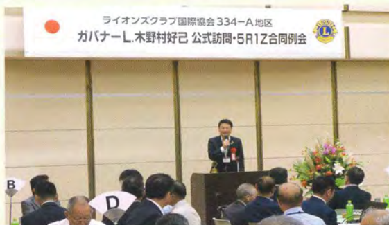
来賓として久世孝宏半田市長にご挨拶いただきました。