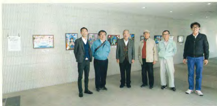
国際平和ポスター優秀作品展示 (市役所1F 市民ギャラリー)