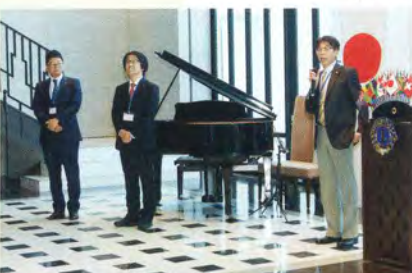
三役エレクト挨拶