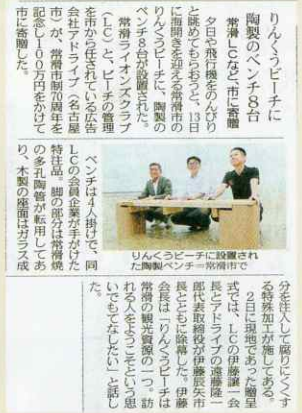
りんくうビーチ 令和6年7月6日(土) 中日新聞知多版に地元ニュースとして掲載されました。